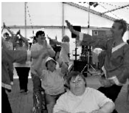
Besonders viel Spaß hatte die Staßfurter Behindertentanzgruppe – die „Stars“ des Sommerfestes.

Unter dem Motto „Handicap 2003 – Was zählt, ist die Einstellung“ hatte das Berufsförderungswerk Sachsen-Anhalt im Juni zu einem Sommerfest in seine Magdeburger Außenstelle eingeladen. Aus Anlass des Europäischen Jahres der Menschen mit Behinderungen wollte das BFW bei Unternehmen für die Einstellung von behinderten Menschen werben und seine breite Dienstleistungspalette präsentieren.