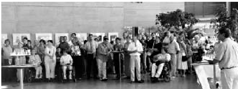
Eine bunte Welt für alle zeigt eine Ausstellung mit Werken behinderter und nichtbehinderter Künstler aus Tschechien, der Slowakei und Sachsen-Anhalt. Sie wurde im Zusammenhang mit der internationalen Begegnungswoche am 16. August im MDR-Funkhaus eröffnet und präsentiert ausgewählte Exponate eines internationalen Mal- und Zeichenwettbewerbs.