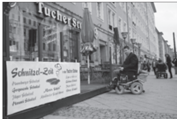
Mit einer einzigen Stufe kann man verhindern, dass man von Rollstuhlfahrern besucht wird

Neben gehörlosen, werden Sie auch unterschiedlich stark schwerhörige Gäste besuchen. Stellen Sie sich darauf ein. Schauen Sie den Gast an. Dies ist besonders wichtig, wenn es starke Nebengeräusche