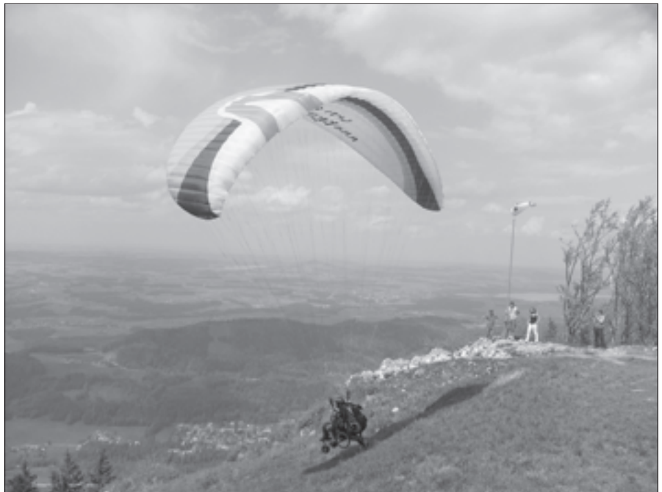
Die Freiheit genießen - Paragleiten für RollstuhlfahrerInnen