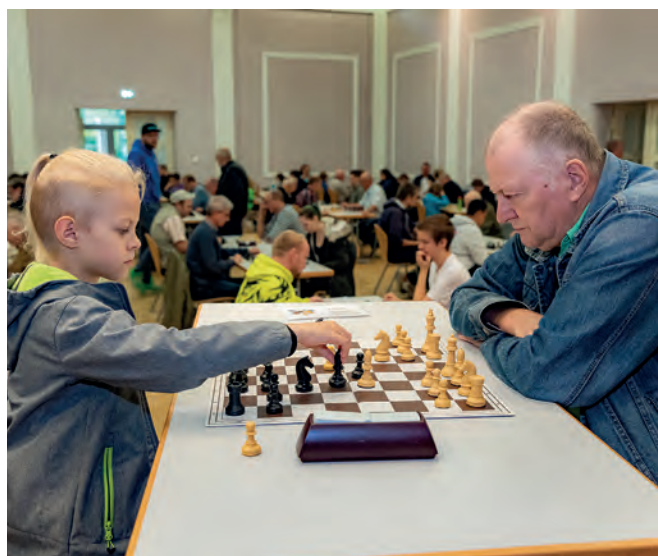
Generationen lieben Schach

Über Inklusion wird gern und viel gesprochen. Wichtig ist und bleibt, sie umzusetzen und zu beweisen, dass und wie sie mit Leben erfüllt werden kann. Das Turnier hat in der Landschaft der inklusiven Sport- und Freizeitangebote einen festen Platz bezogen. 2024 kann kommen und stellt das Organisationsteam vor neue Herausforderungen. Keine Frage, Fortsetzung folgt.