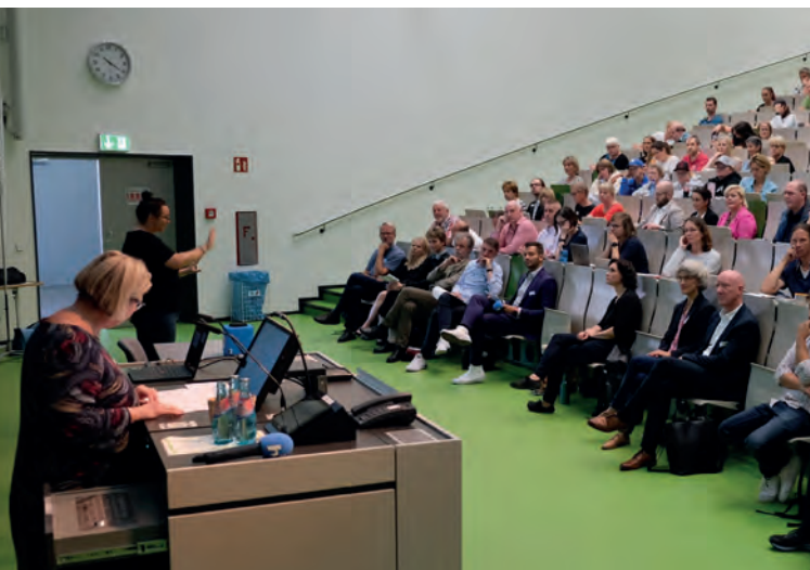
Fachtagung „Inklusion ohne Grenzen?“

In allen Arbeitsgruppen wirkten Expert*innen in eigener Sache mit – als Leitungen der Arbeitsgruppen und als Teilnehmende. In den Arbeitsgruppen tauschten sich die Teilnehmenden zu Herausforderungen, Chancen und guten Beispielen aus.