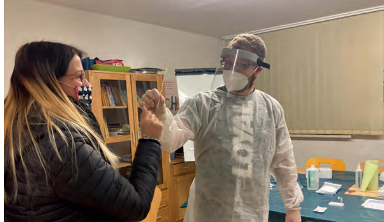
Alltag mit Vorsicht